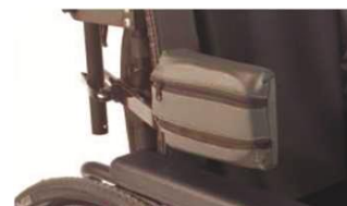
Опора для тела