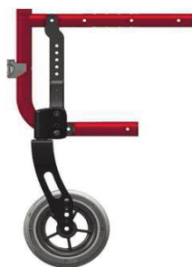
Неврологический вариант рамы