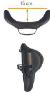
Спинка Jay 3 Глубокий контур