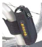
Кармашек для мобильного телефона